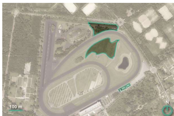
Espace 3000 et grande plaine